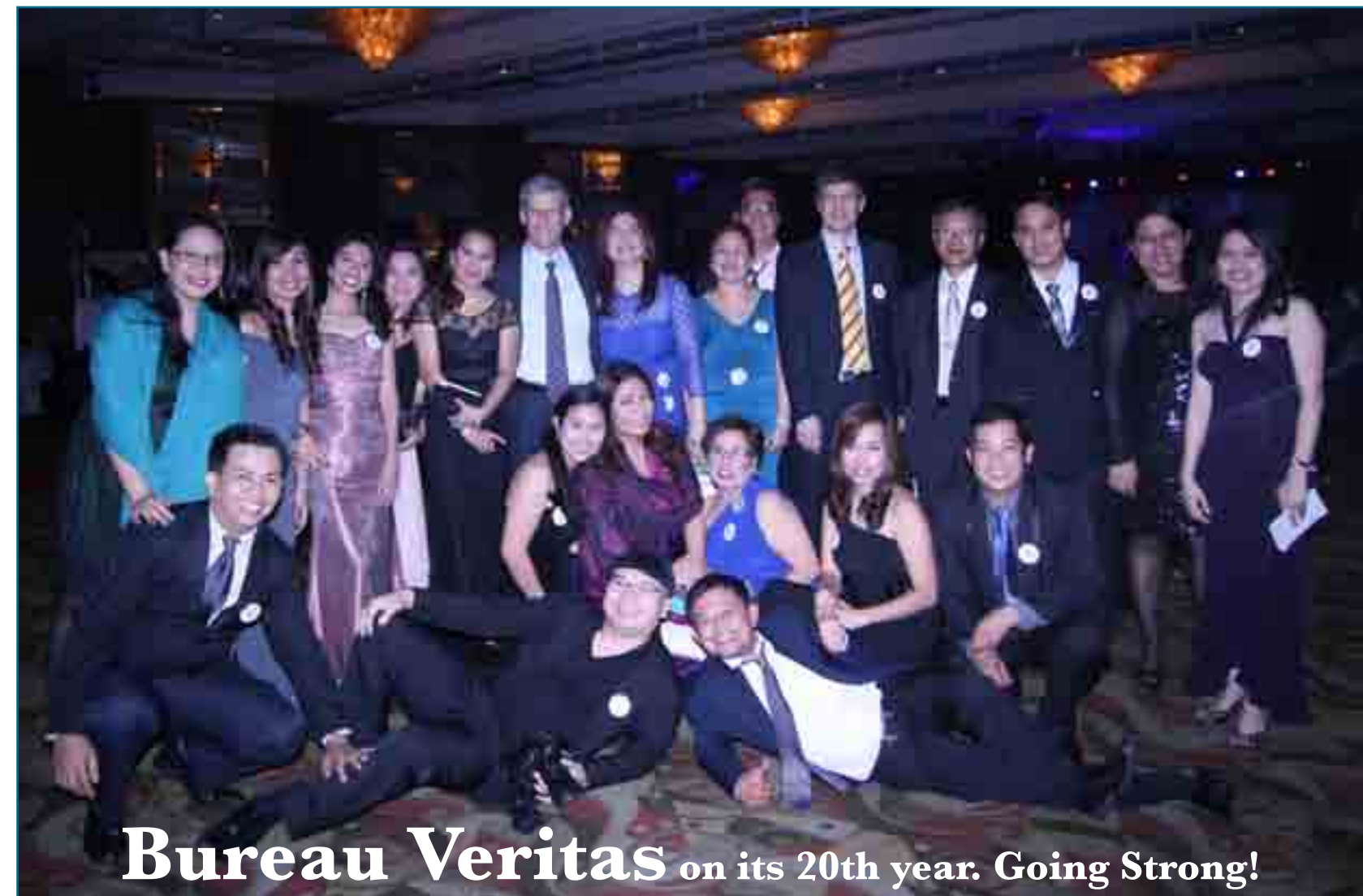
Bureau Veritas on its 20th year. Going Strong!