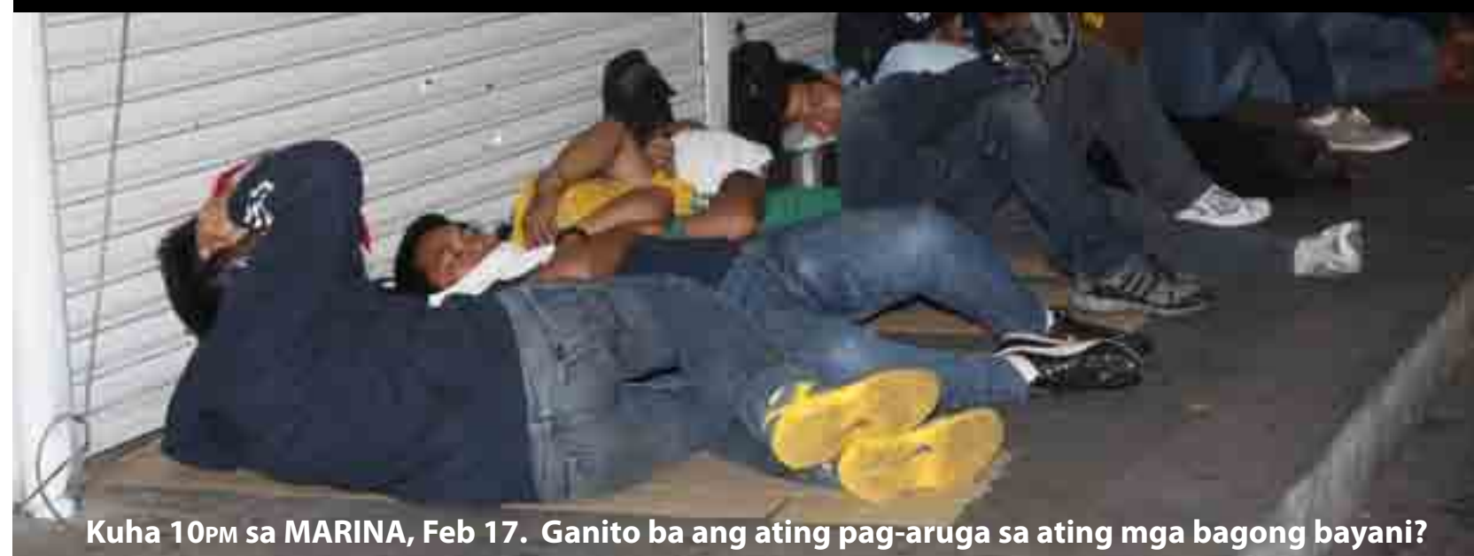
Kuha 10PM sa MARINA, Feb 17. Ganito ba ang ating pag-aruga sa ating mga bagong bayani?